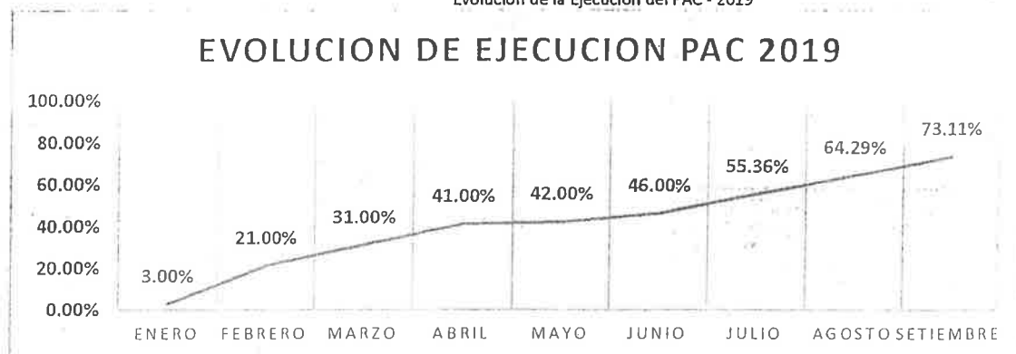
Gráfico N°-06 Evolución de la Ejecución del PAC - 2019