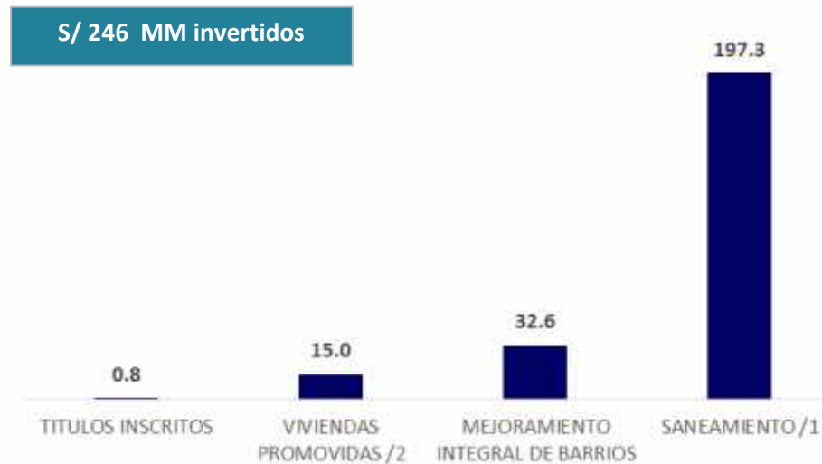
INVERSIÓN DEL MVCS SEGÚN PRINCIPALES PROGRAMAS, Agosto 2016 - Agosto 2017 (En millones de soles)

1/ Saneamiento : Incluye los programas de saneamiento urbano y rural