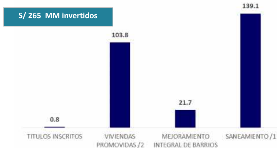
INVERSIÓN DEL MVCS SEGÚN PRINCIPALES PROGRAMAS, Agosto 2016 - Agosto 2017 (En millones de soles)

1/ Saneamiento : Incluye los programas de saneamiento urbano y rural