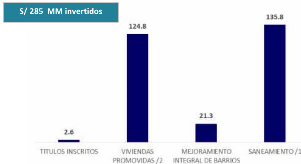
INVERSIÓN DEL MVCS SEGÚN PRINCIPALES PROGRAMAS, Agosto 2016 - Agosto 2017 (En millones de soles)

1/ Saneamiento : Incluye los programas de saneamiento urbano y rural