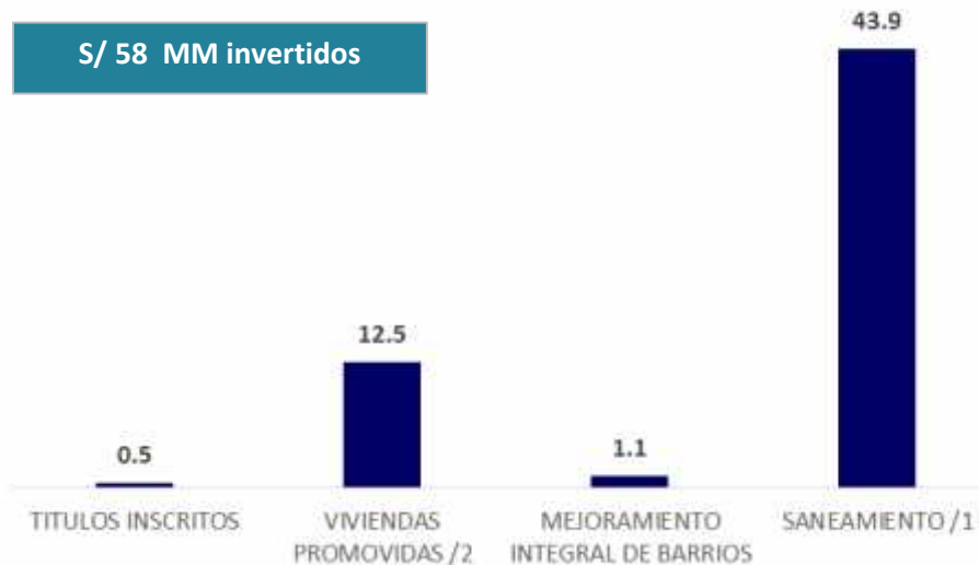
INVERSIÓN DEL MVCS SEGÚN PRINCIPALES PROGRAMAS, Agosto 2016 - Agosto 2017 (En millones de soles)

1/ Saneamiento : Incluye los programas de saneamiento urbano y rural